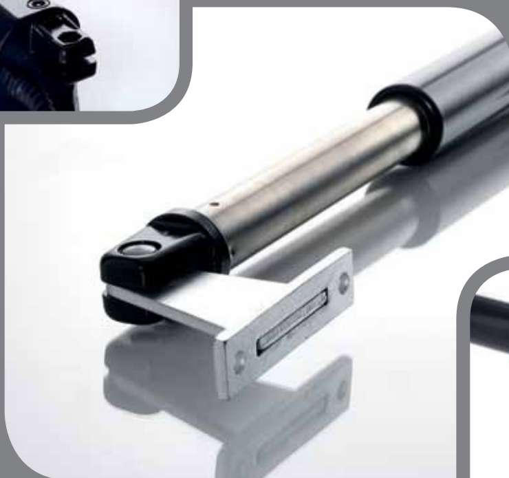
Patte de fixation en acier cadmié (anti-oxydation)